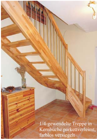
1/4-gewendelte Treppe in Kernbuche parkettverleimt, farblos versiegelt